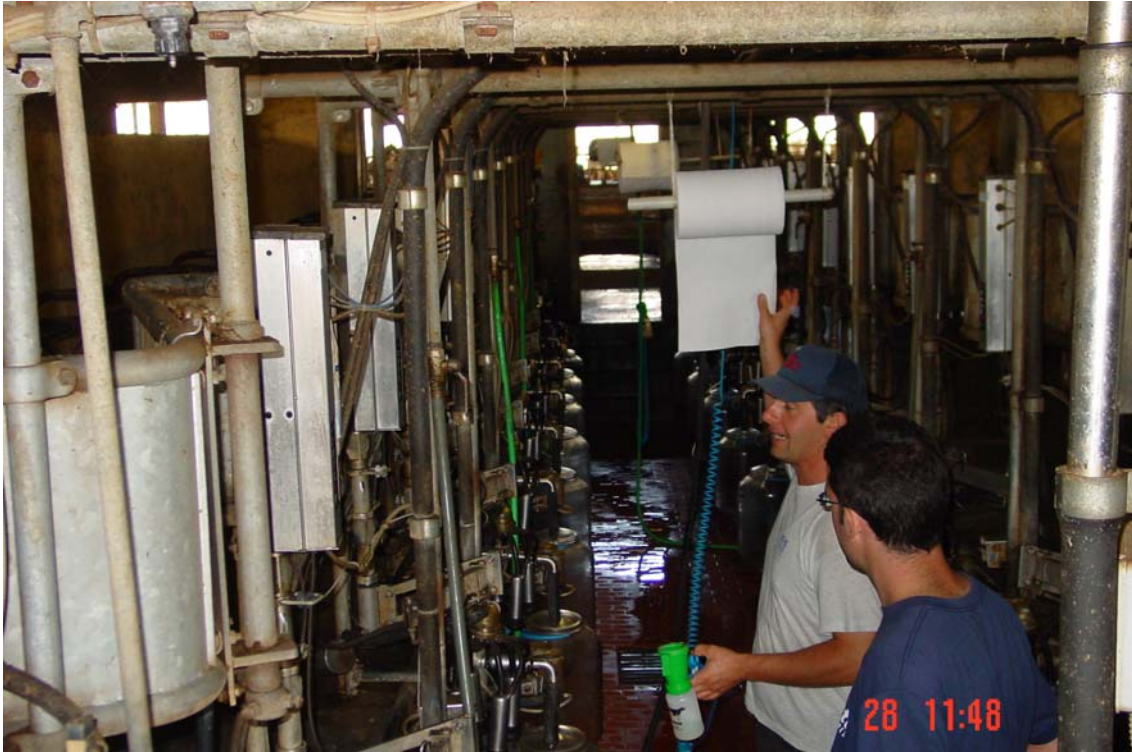
Sala de munyir