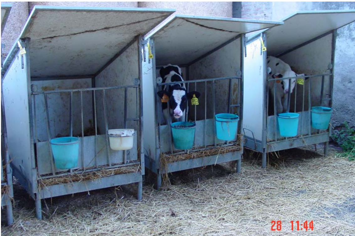
Boxes per a vedells, enlairats