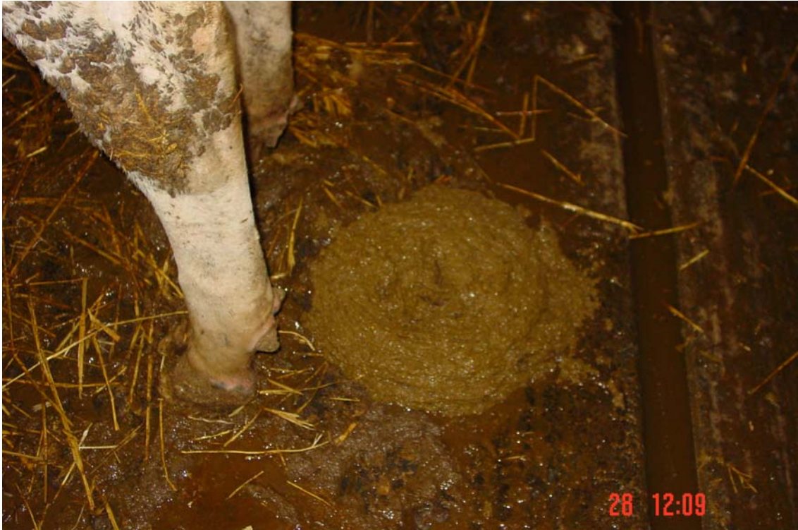
Buïna correcte de grandària i forma