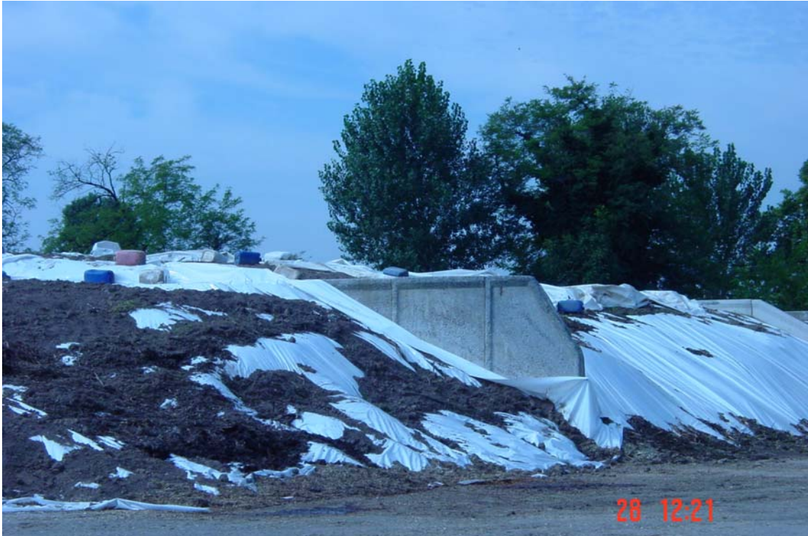
Ensitjats blat de moro