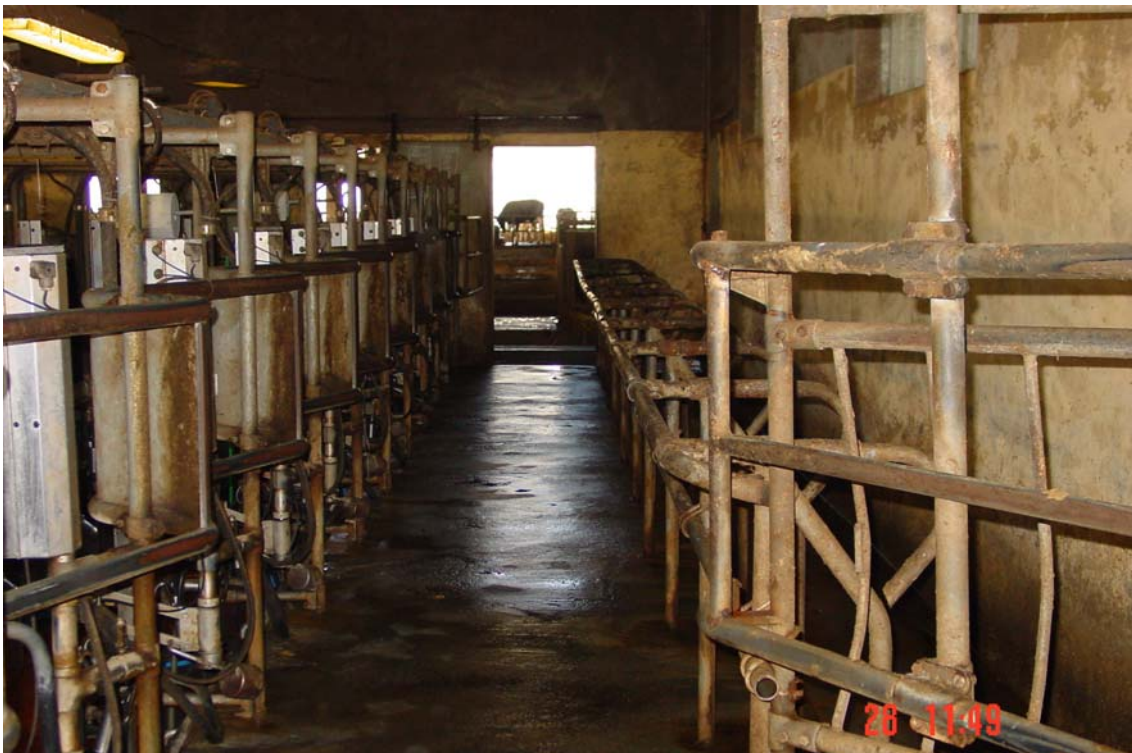
Passadís sortida sala munyir