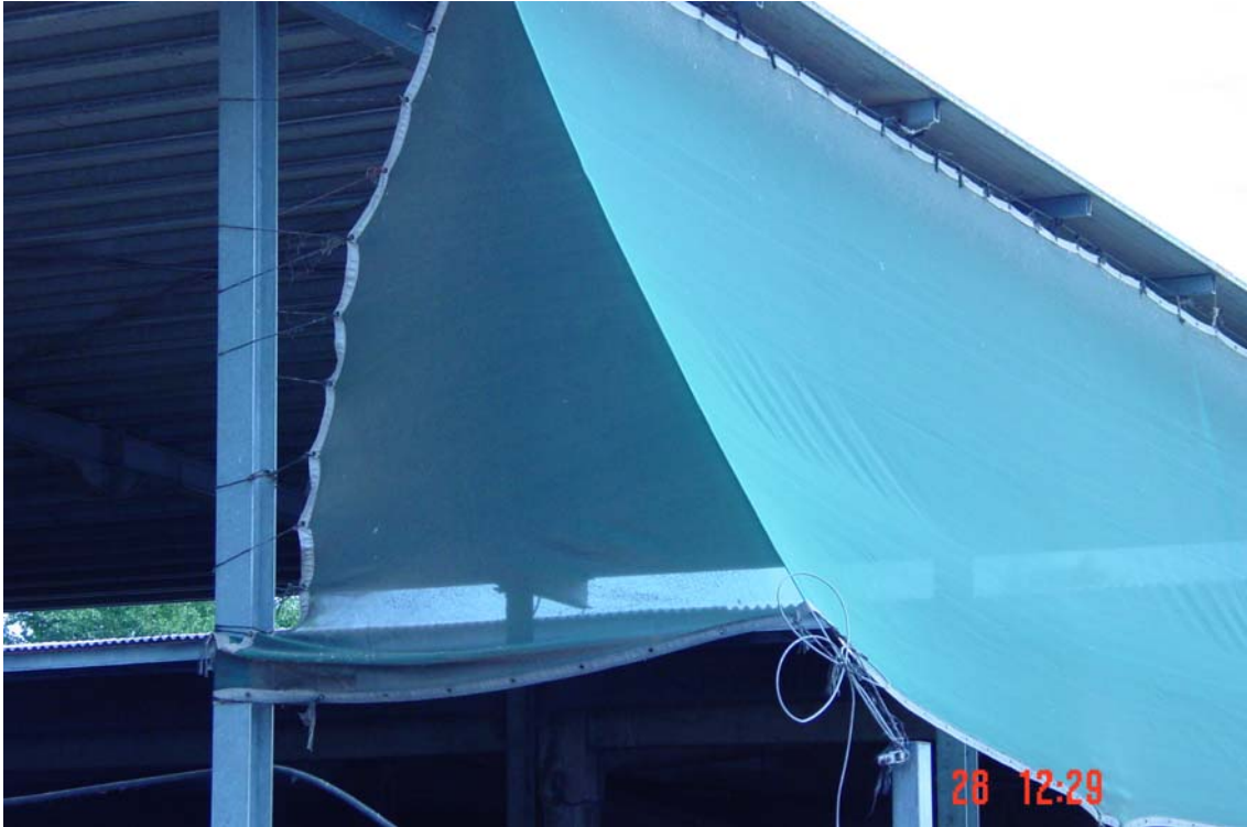
Per ombra al lateral de l'establació