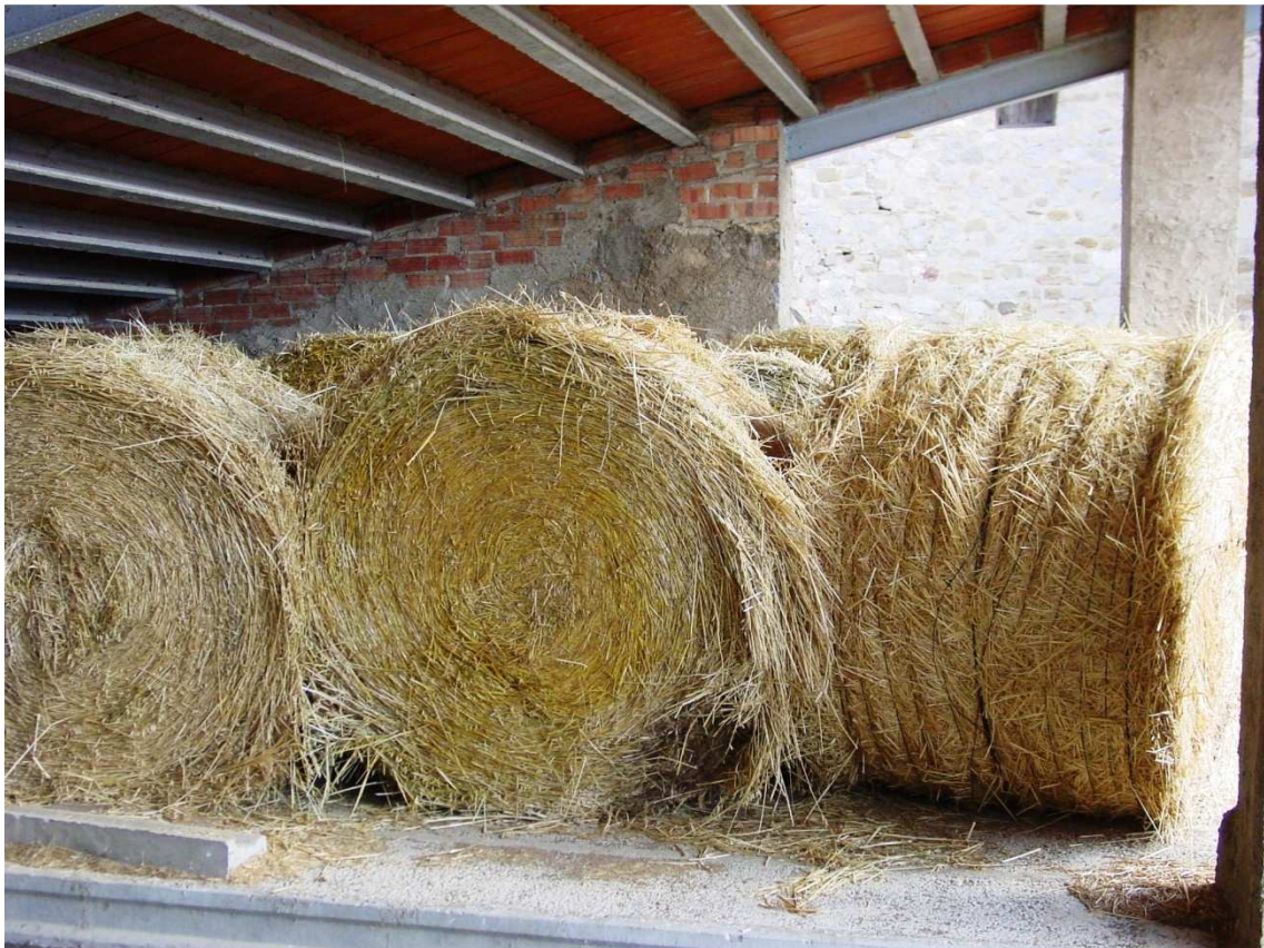
Sec de civada