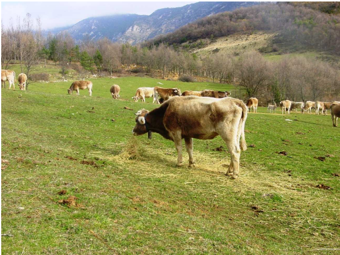
Bruna menjant sec d'herba de prat