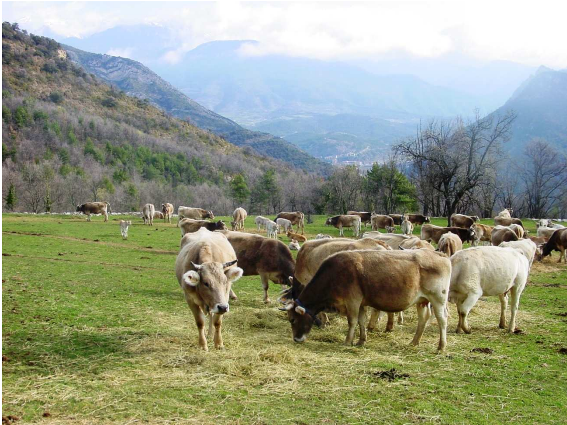
Brunes menjant sec d'herba de prat