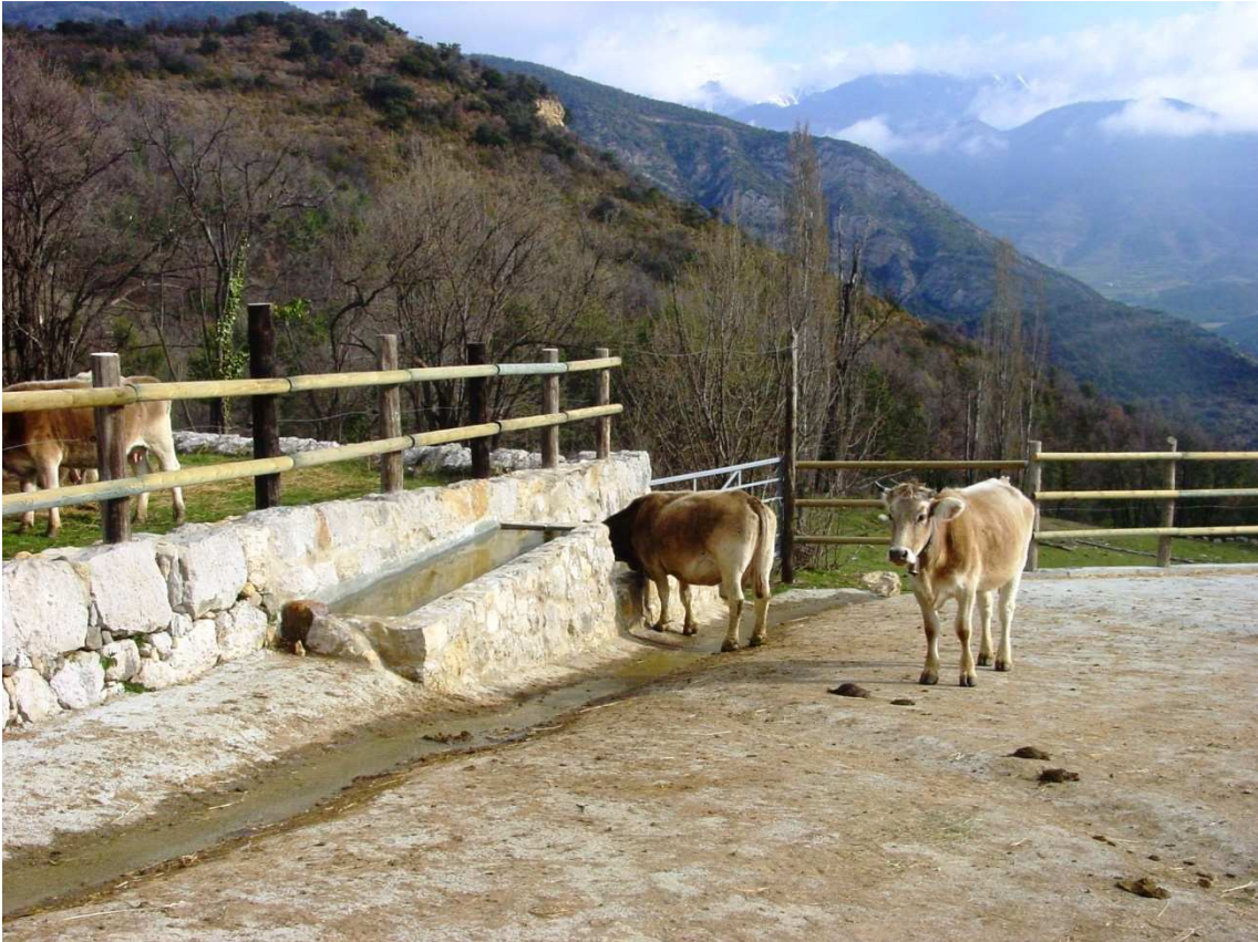
Vaca a l'abeurador