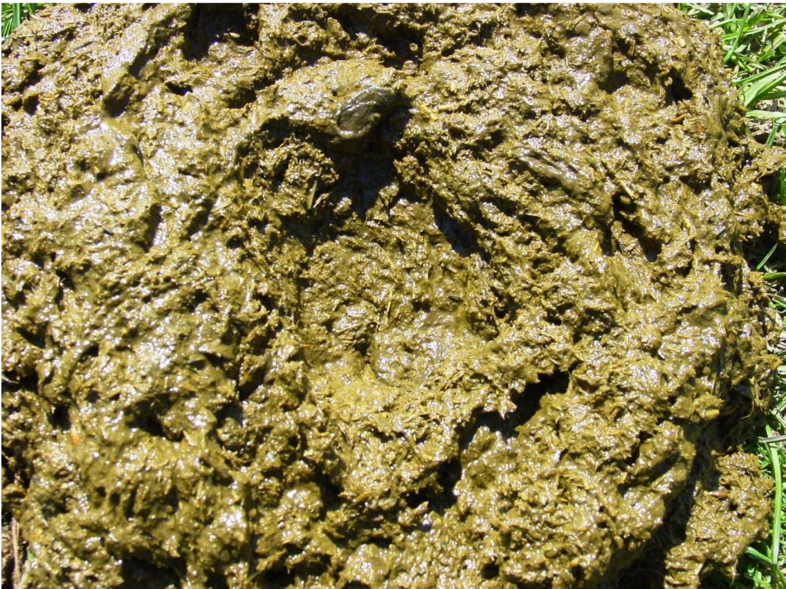
Detall de buina, cal observar el nivell de desfeta d'una ració exclusivament farratgera