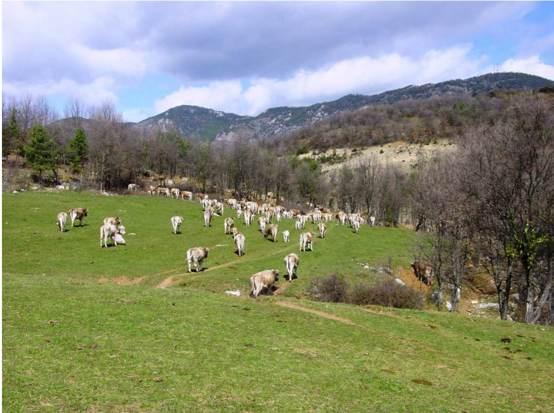
Ramat de brunes