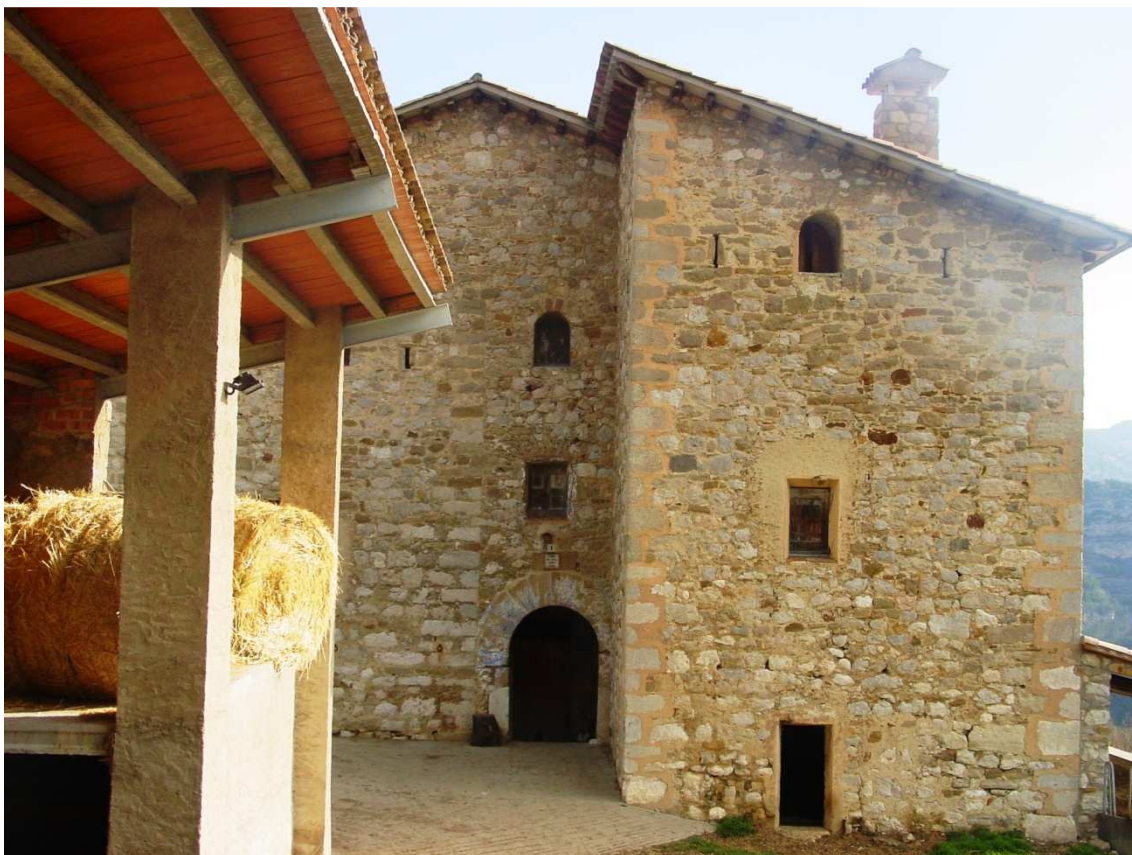
Torre de Foix