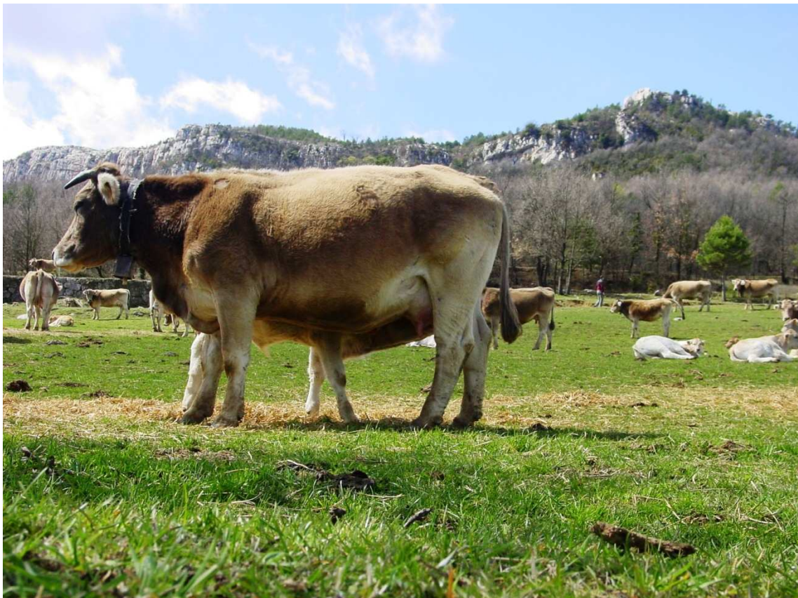
Bruna i vedell