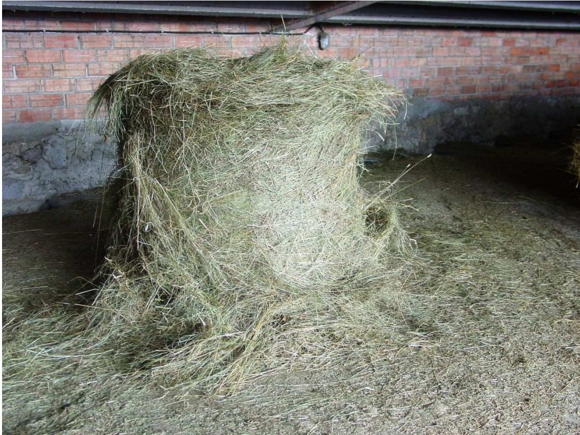
Sec d'herba de prat, on predomina la festuca