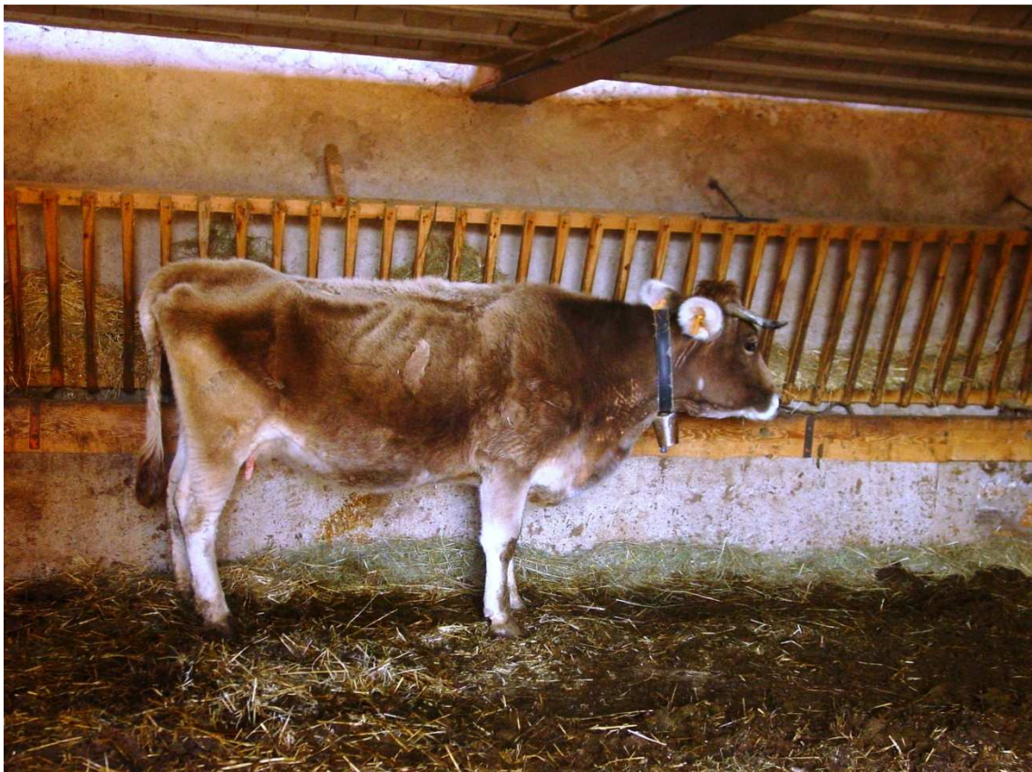
Vaca recent parida