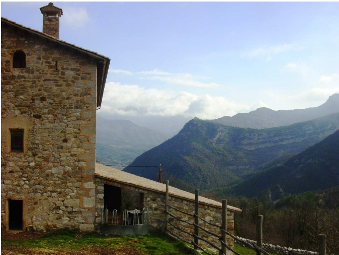
Torre de Foix