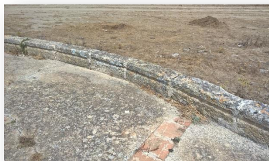
Detall de la barana de l’era