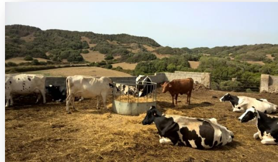
Vaques remugant i a la menjadora mòbil de farratge sec

Les despeses es fan al 50%, amb certes excepcions en alguns capítols de l'explotació.