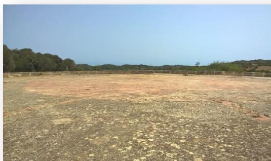
Terra de l’era

Aquesta era de la foto no sembla que estigui en ús, ni per al que es feia temps enrere ni per altres usos. Les eres tenen el seu moment en els segles XIX i XX –primera meitat–, estan enrajolades o cobertes de lloses, són circulars i el perímetre està tancat amb blocs de marès, en general. Els blocs de marès del tancat solen tenir una osca per tal que les formigues no s’enduguessin el gra 3 . Les eres són d’entre 10 i 20 m de diàmetre 4 . En ella s’hi batien els cereals, s’hi ventaven i s’ereraven –passar per una garbera–, i ja, al final, es mesurava el gra, amb barcelles -mesura de gra, equivalent aproximadament a la sisena part d’una quartera 5 - i es conclouïa amb una festa on s’hi convidàvem els pagesos del voltant.