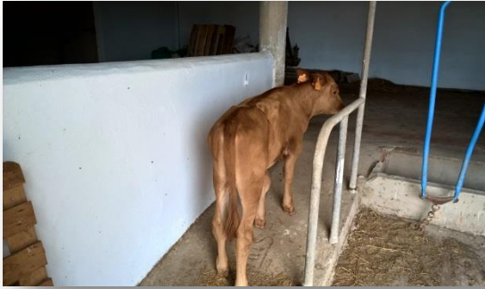
Vedell que anirà a pastura