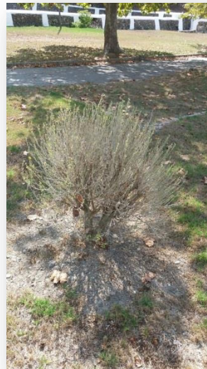
Medicago arborea a l'hivern i a l'estiu