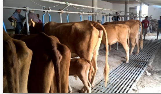
Vaques a l'estabulació

Aquest ramat de vaques menorquines pasturen a Puigmenor, els vedells són criats per les mares en total llibertat i pasturen fins els 10 mesos, en que fan entre 225 i 250 kg/canal. El preu de la carn d'aquests vedells és de 4,5 €/kg canal. El lloc de Puigmenor té 70 ha, de les quals 20 són de cultiu.