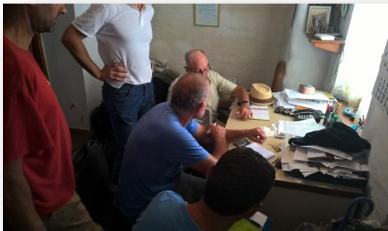
Estimadors, pagesos, propietari, tots a punt de conèixer la primera valoració