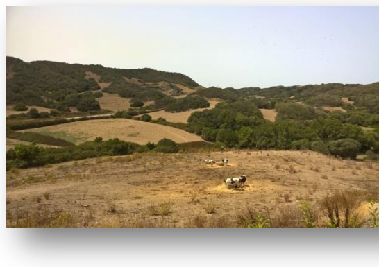
Paisatge menorquí el juliol