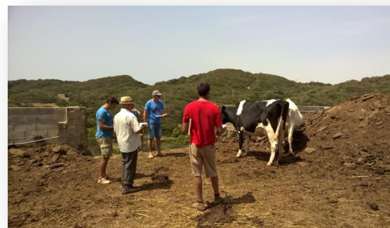
Estimadors amb els pagesos (entrant i sortint)