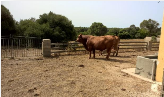
Brau de raça menorquina

En el contracte s'estableix com es repartiran els beneficis. El sistema de repartiment més usual és aquell en que els ingressos del treball de la terra i del bestiar sigui per meitat entre els dos socis, però no sempre és així, ni hauria de ser-ho ni per llei ni per costum.