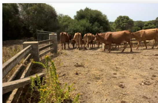
Vaques de raça Menorquina cap a pastura de rostoll

En canvi, l'enginyer cap de la Secció Agronòmica de Balears, Antonio Ballester Llambías, en el discurs inaugural de l'Ateneu el 1921 18 , fa un repàs més crític tant en l'aspecte agrícola i ramader com en el social dels contractes (Ballester Llambías A., 1921). En el meu entendre se li nota que l'agricultura no li ve de nou, i no deixa de ser ben actual i de rigor. A més a més, diu que les causes que determinen que els factors de producció d'un país siguin d'una manera o d'altre són, la idiosincràsia de la gent, el nivell cultural, la situació econòmica, les relacions socials, els mercats exteriors, la comunicació amb els altres països i, finalment, la voluntat de la persona. Açò, per a mi, és el que defineix la gent d'un lloc. En la seva opinió es cultivava pèssimament, amb maquinària primitiva, sense adobar el sòl; els bouers bruts, mal distribuïts i sense una higiene mínima. Les vaques de cria arribaven a la pastura de l'herba extenuades,