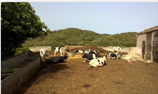
Pati o zona d'exercici de l'estabulació

A continuació a la zona d'exercici de l'estabulació de Milà Vell s'hi concentren les vaques en lactació, a un costat, i a l'altre els estimadors. Les van passant de dues en dues per a la valoració. Milà Vell té 55 ha de les quals 50 són de cultius.