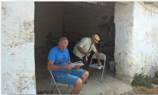
Estimadors a punt de concretar

Al voltant de les dues, els estimadors, apart dels pagesos i convidats, deliberen i posen en comú les valoracions. La resta d'assistents passem al menjador i a la cuina de les cases per tal de menjar i beure allò que la família del pagès sortint ha preparat per a celebrar l'estim, que tothom espera sigui satisfactori a les dues bandes.