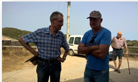
Estimador i el director de Sa Granja

El que des de la compilació legal (1961) s'anomena Societat Rural Menorquina (SRM) és una societat civil constituïda per dos socis , el titular o propietari i el cultivador o pagès , i s'estableix mitjançant un contracte amb el qual el lloc serà explotat. Sense entrar massa en detalls, el més principal és que el propietari posa a disposició de la SRM el lloc i les cases de pagès, així com les estabulacions i d'altres edificis i construccions necessaris per a l'explotació, i el pagès posa la feina i, en general, la de la seva família.