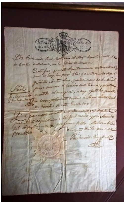
Autorització ús de senyal per al bestiar (1829)