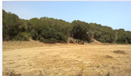
Ormejos de treballar el camp

El contracte amitges compilat a través de la SRM fa esment a la part del lloc, o a la seva totalitat segons s'hagi especificat, que es posa en explotació per treure'n uns fruits. En principi, si no es diu o s'estipula res al respecte, la caça i la llenya són del propietari, però el pagès podrà tallar la que necessiti per al seu consum (Bosch Marquès, R. 1994). Sovint el tema de la caça és motiu de conflicte quan no hi ha savoir fer . Ni tots els propietaris són senyors, ni tots els senyors ho són de mena.