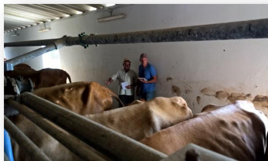
Els estimadors deliberant