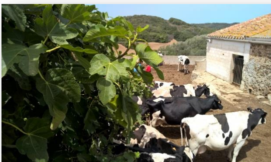
Vaques concentrades per passar a valoració