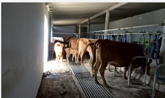
Vaques menorquines a la menjadora

En el nostre cas, primer vam anar al lloc Puigmenor, on hi havia els animals destinats a carn, vaques menorquines i els seus vedells. Estaven estabulats a la menjadora, i els dos estimadors van passar per darrere la fila d'animals.