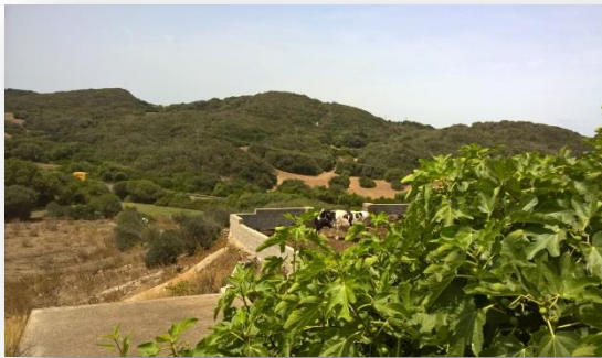
Marina, figuera i vaques