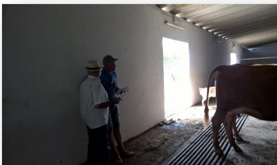
Els dos estimadors observant vaca a vaca