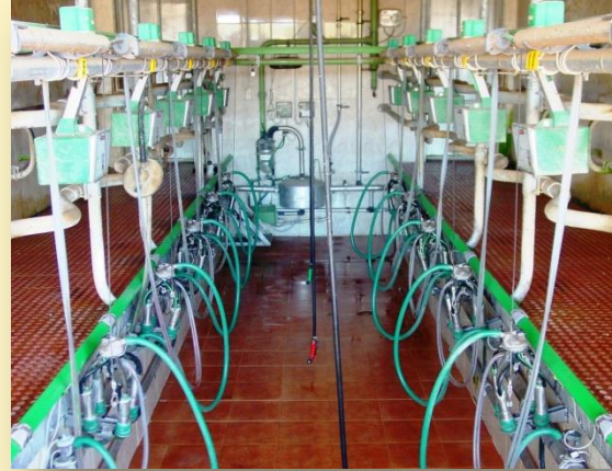
Espina de peix 2x5 amb retiradors

L'establació lliure és amb 48 cubicles, amb llit d'arena (a 5€/m 3 ), en els passadissos hi ha instal·lat un sistema de recollida de dejeccions amb tiràs, i les condueix al femer que és al final de l'establació, amb capacitat per a 300 t (per 4 mesos, aproximadament). A la menjadora hi ha 49 llocs amb autocapturadors.