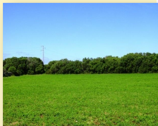
Camps d'alfals i TRAC