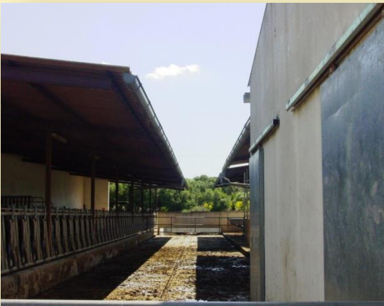
Establació i sala de munyir

L'establació lliure és amb 48 cubicles, amb llit d'arena (a 5€/m 3 ), en els passadissos hi ha instal·lat un sistema de recollida de dejeccions amb tiràs, i les condueix al femer que és al final de l'establació, amb capacitat per a 300 t (per 4 mesos, aproximadament). A la menjadora hi ha 49 llocs amb autocapturadors.