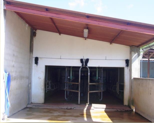
Sala d'espera entrada a sala de munyir