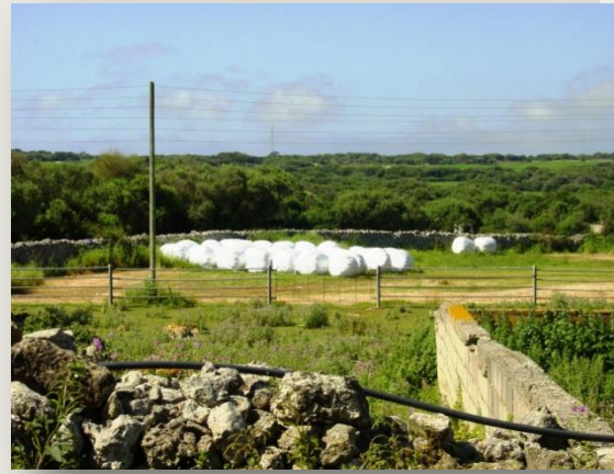
Bolles (ensitjat de raigràs)

En anys normals, al cap de dos mesos començaria la pastura, que hauria de durar fins a finals de febrer, per després deixar la parcel·la per fer bolles d'ensitjat, i si plou al maig encara fer un dall per assecar. A Menorca és freqüent sembrar civada pel creixement ràpid que té, i en molts casos se sembra amb raigràs. En Sebastià prefereix el raigràs sol, la civada és volum, el raigràs qualitat . Atès el nombre de vaques, té comptat que per a un any necessita 10 bales per vaca present 5 munyint tot l'any, per tant, el total serà de 280 a 350 bolles d'ensitjat i 100 bales de sec. Cada bala o bolla pesa de 450 a 600 kg, depenent de l'època de l'any.