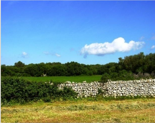
Raigràs segat i arrengrerat

bolles encintades ensitjat de bolla amb maquinaria pròpia: segadora, rastell, embaladora i encintadora –, per això diu que ha d'actuar tanca a tanca ja que és ell sol i no pot tenir diverses tanques alhora, i en un dia fa entre 30 i 40 bolles. El raigràs el sembra el setembre si el terreny té saó, i sinó quan plou i, lògicament, el sòl ho permet. Sobre aquest punt de la sembra ens explica que en aquest terreny hi ha moltes formigues, i, per això, mai no pot sembrar si no s'assegura un bon ritme de pluges; a més a més, el sòl no és de maneig fàcil. Un altre aspecte important del maneig del raigràs és l'adobament. Els adobs utilitzats són el 15-15-15 i el nitrat amònic 27%, després de cada aprofitament. Les quantitats varien en funció de si l'aprofitament es pastura o sega. Per qüestió d'organització de les feines el 15-15-15, encara que és un adob de fons, el tira damunt del cultiu.