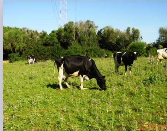
Vaques a partir de la cria pròpia

La producció real s'adapta a la quota, ja que és la que permet la producció farratgera. Segons el control lleter, la producció mitjana per lactació és de 9.000 kg. La producció per vaca present està al voltant dels 8.000 kg anuals. A l'hivern la producció diària per vaca munyida està entre 25 i 27 kg, i a l'estiu passa a 20-22 kg.