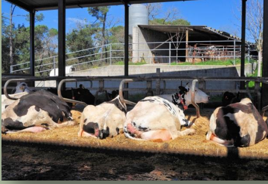
Vaques als cubicles i al fons recria