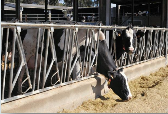
Vaques a la menjadora

Pel que fa al racionament disposa d'un remolc barrejador unifeed, on hi mescla 20 kg d'ensitjat de blat de moro, 3,5 kg de fenc d'alfals (comprat), 1,5 kg de palla i 10,5 kg de farinada (blat de moro, soja, entre d'altres). Al robot hi subministra 3 kg de concentrat equilibrat per vaca i dia, si bé a les que fan menys de 30 kg de llet les rebaixa la quantitat. La ració unifeed és per al manteniment i 35 kg de llet i no la varia en tot l'any. L'ensitjat de la mescla de farratges el subministra a la recia.