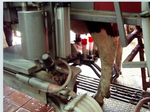
Col·locació automàtica de mugroneres

A l'apartat "GALERIES DE FOTOS" dins de les visites podem trobar la seqüència de fotos de les visites.