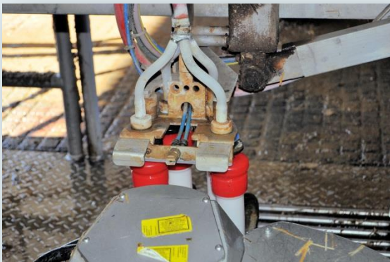
Neteja automàtica del robot de munyida