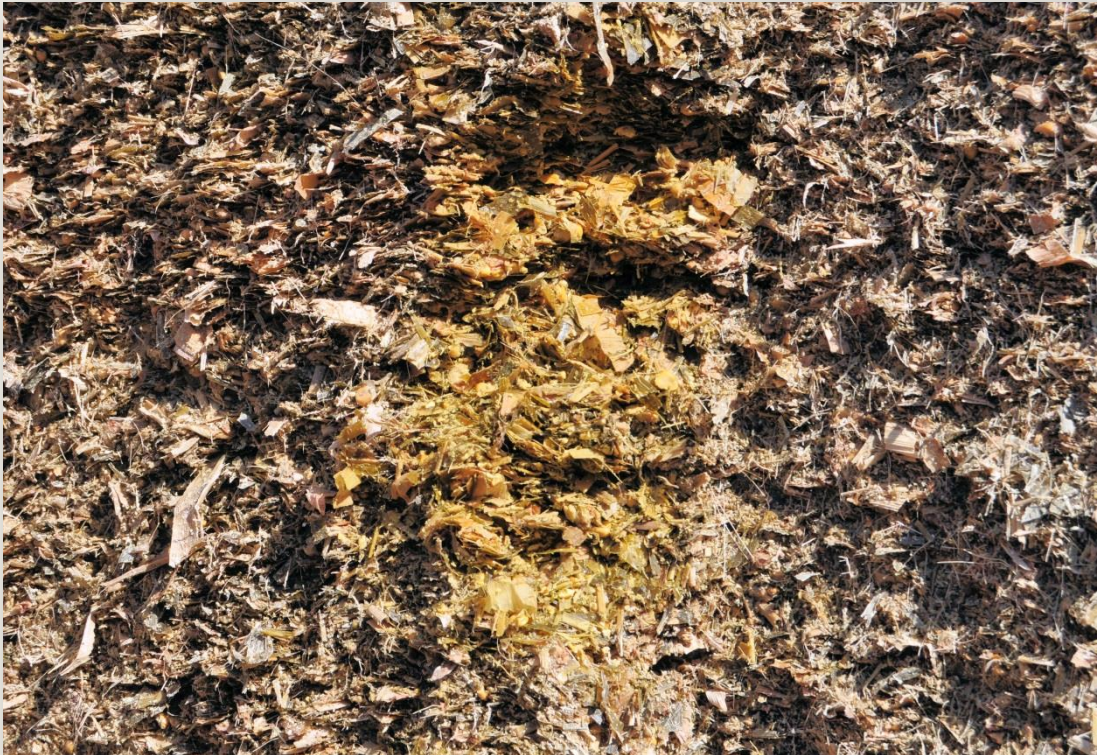
Detall ensitjat de blat de moro (30% MS)

A la superfície farratgera hi fa doble cultiu en regadiu, el primer és una mescla de tritcale, veça, trèvol i raigràs, a la qual hi segueix el blat de moro. Els dos cultius, la mescla i el blat de moro, els ensitja. Disposa d'una bassa emmagatzemadora-reguladora per al rec de 25.000.000 litres.