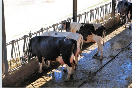
Passadís d'alimentació i guia per al tiràs