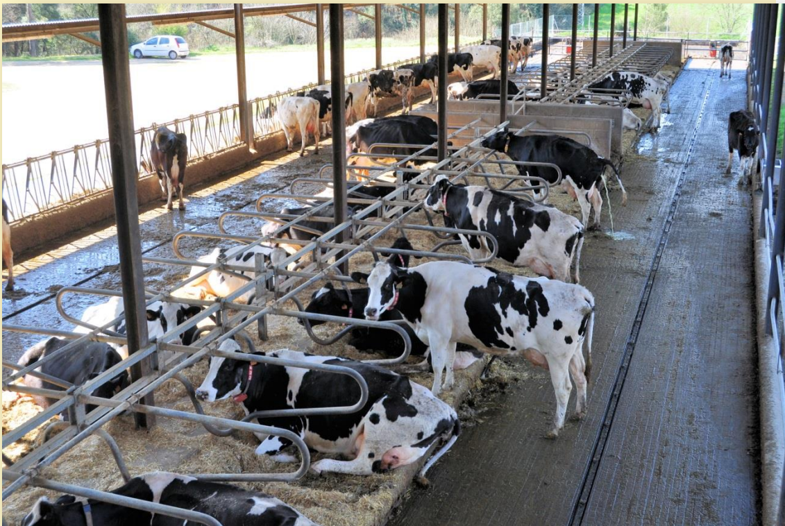
Estabulació oberta, passadís d'alimentació i de llotges

L'estabulació és lliure amb llotges (cubícles), amb un sistema de neteja amb tiràs que condueix a la fossa de fems fluids d'una capacitat de 1.000 m 3 . La resta d'allotjaments són estabulacions amb palla, que constitueixen l'antiga estabulació lliure de les vaques, on hi ha les eixutes i la recria, situades en un nivell superior respecte on hi ha les vaques en l'actualitat. L'estabulació i el robot per a la munyida es feren alhora, de manera que l'entrada i sortida al robot no presentat cap dificultat a les vaques.