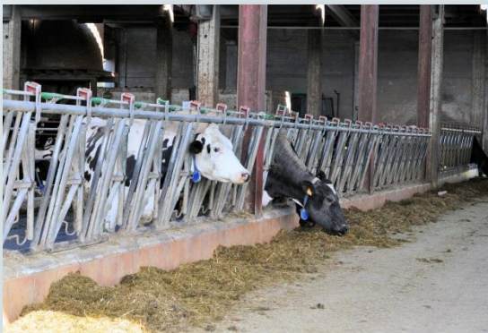
Vaques a la menjadora

Pel que fa al racionament disposa d'un remolc barrejadur unifeed i fa dos subministraments al dia. Actualment als dispensadors automàtics de concentrat –dos en total– distribueix 1 kg de pinso per tal de complir el període d'adaptació.