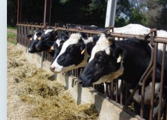
Vedelles a 4 mesos del part

Fa sincronització de zels. Ració: 50% d'una barreja a base de sec de civada, ensitjat de sorgo i ensitjat de raigràs, i 50% la ració unifeed de les vaques de llet.