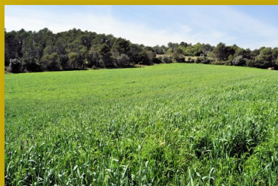
Camp de tritcale i veça