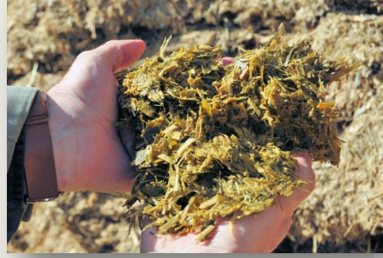
Ensitjat de sorgo (28 % MS)

Pel que fa al racionament disposa d'un remolc barrejadur unifeed i fa dos subministraments al dia. Actualment als dispensadors automàtics de concentrat –dos en total– distribueix 1 kg de pinso per tal de complir el període d'adaptació.