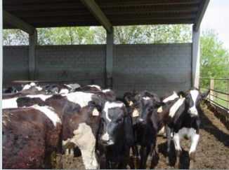
Vedelles de 6 a 12 mesos

Les vedelles de reposició, del naixement fins al sis mesos, estan a un annex a l'estabulació de vaques, després passen a l'estabulació de recria, situada en una explotació veïna que tenen llogada, la qual està dividida en quatre compartiments: de 6 a 12 mesos, al voltant de 15 mesos, de 18 a 20 mesos, i les que estan a quatre mesos del part.