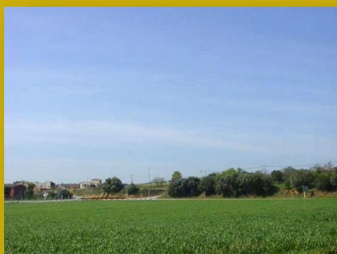
Camp de raigràs

A la superfície farratgera hi fa 45 ha de raigràs que s'aprofitarà ensitjat, 20 ha d'usurda, amb tres dalls –el segon el destina a sec i els altres a bales encintades–, 35 ha de civada per a fenc –sec de civada en flor–, 12 ha de sorgo per ensitjar, 25 ha de tritcale i veça i mescla de tritcale, veça, raigràs i trèvol, que dedica a ensitjar. La resta és guaret. Un cop ha ensitjat, fa anàlisi de cadascun d'ells per tal de formular les racions amb criteri.