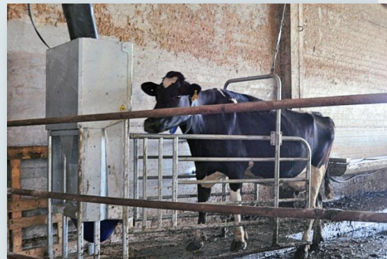
Vaca entrant al DAC

La ració la formula amb l'aplicació informàtica del Grup de remugants , a disposició pública al web: