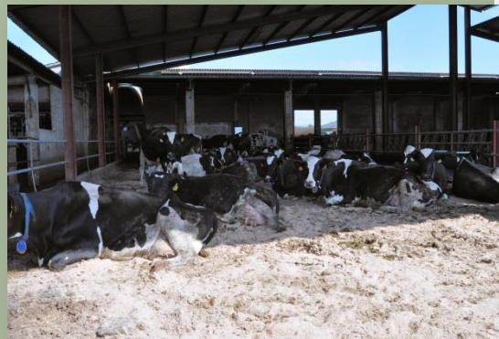
Vaques a zona llit calent

A la superfície farratgera hi fa 45 ha de raigràs que s'aprofitarà ensitjat, 20 ha d'usurda, amb tres dalls –el segon el destina a sec i els altres a bales encintades–, 35 ha de civada per a fenc –sec de civada en flor–, 12 ha de sorgo per ensitjar, 25 ha de tritcale i veça i mescla de tritcale, veça, raigràs i trèvol, que dedica a ensitjar. La resta és guaret. Un cop ha ensitjat, fa anàlisi de cadascun d'ells per tal de formular les racions amb criteri.