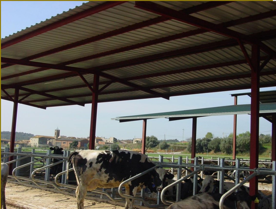
Vista general de les vaques als cubicles

L'explotació Can Nogué SCP a Cistella (Girona) té, aproximadament, una superfície farratgera de 150 ha en secà, 215 caps de boví lleter (125 vaques de llet i 90 vedelles de reposició) amb una quota d'1.200.000 kg de llet. La societat la formen Jaume Nogué i Moisès Nogué . L'establació està en actiu des de 1989, en la ubicació actual, a les afores de Cistella. Aprofitant la distribució de les naus s'ha anat reformant des de 2010, any en que s'incorporà, com a jove agricultor, Moisès Nogué, ramader i, alhora, enginyer agrònom. Les reformes, a punt d'acabar, començaren amb la sala de munyir espina de peix 2x6 i es cobriren els patis. Entre 2012 i 2013 es construí una sitja, zona de cubicles (per a 90 vaques) amb sistema mecanitzat d'extracció de dejeccions, i una fossa de fems d'1.000.000 litres de capacitat (per a sis mesos). Alhora, s'instal·laren dos dispensadors automàtics de concentrats. La idea de les reformes se sustenta en la necessitat de millorar les condicions de feina, i que les vaques i vedelles estiguin en bones condicions de benestar. L'explotació, en general, es basa en l'aprofitament dels recursos farratgers. La mà d'obra és de 3 UTA.