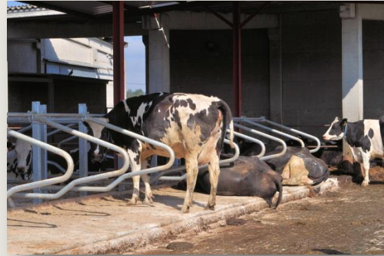
Vaques seleccionades a partir de la recia