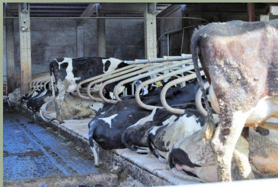
Vaques als cubicles

L'estabulació està dividida en tres zones. A la zona de llit calent, amb DAC incorporat, hi ha les vaques adultes (a partir del tercer part) des del part fins al final de lactació (a l'explotació s'està renovant el ramat amb l'objectiu d'adaptar-lo als DAC), i les braves que s'hi estan entre 1 i 2 mesos (segons producció). A la zona de cubicles, un pati amb 60 llocs on hi ha un DAC, i un altre pati amb 30 llocs sense DAC.