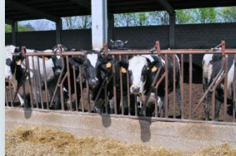
Vedelles al voltant de 15 mesos

Fa sincronització de zels. Ració: 50% d'una barreja a base de sec de civada, ensitjat de sorgo i ensitjat de raigràs, i 50% la ració unifeed de les vaques de llet.