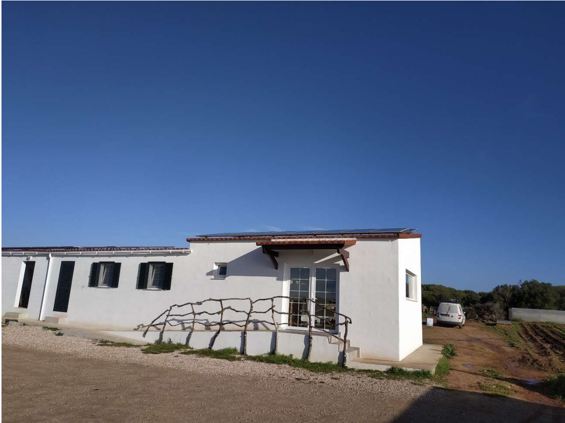
Botiga amb les plaques solars

Les herbes, males herbes, són el principal problema, ja que no empen herbicides. La patata té el rovell com problema i el tomàtic la tuta.