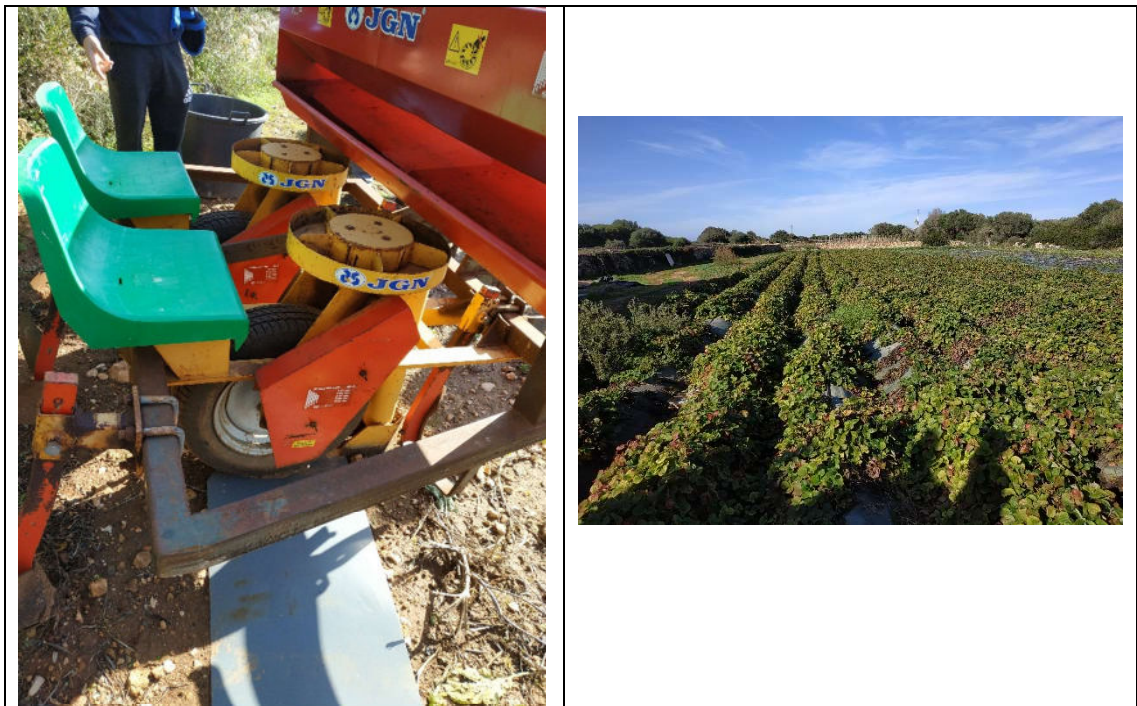
Sembradora i cultiu maduixes

Les herbes, males herbes, són el principal problema, ja que no empen herbicides. La patata té el rovell com problema i el tomàtic la tuta.