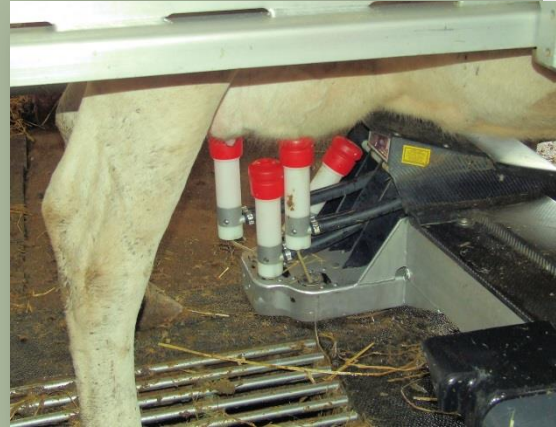
Col·locació automàtica de mugroneres

A la superfície farratgera hi fan raigràs (22 ha) i l'aprofiten en verd, ensitjat i fenc, ordi (8 ha) aprofitat en gra i com a palla, i en les 10 ha de regadiu hi fan 3 ha d'alfals, també aprofitada en verd, ensitjada i en fenc, i 7 ha destinades al blat de moro per ensitjar.