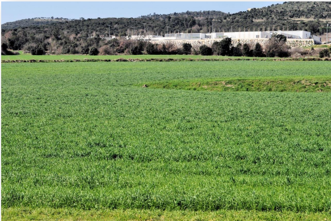
Camp de raigràs italià

A la superfície farratgera hi fan raigràs (22 ha) i l'aprofiten en verd, ensitjat i fenc, ordi (8 ha) aprofitat en gra i com a palla, i en les 10 ha de regadiu hi fan 3 ha d'alfals, també aprofitada en verd, ensitjada i en fenc, i 7 ha destinades al blat de moro per ensitjar.