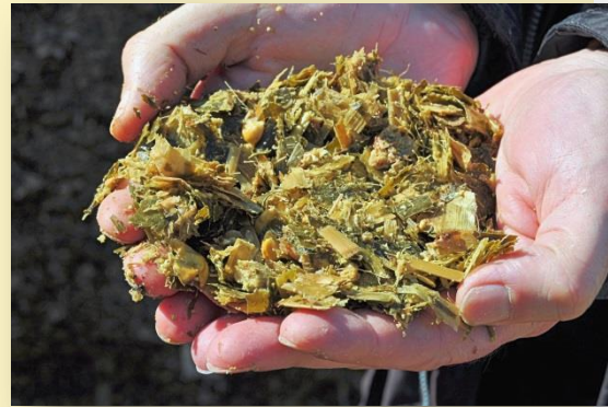
Detall ensitjat de blat de moro (29-30% MS)

Des d'abril de 2009 en que s'instal·là el robot el maneig de l'explotació ha canviat. La primera visita del ramader, a quarts de set del matí, és al despatx, per tal d'assabentar-se de les incidències en la munyida, registrades per mitjà del programa informàtic del robot. A continuació passa a fer la neteja automàtica del robot, la qual dura aproximadament mitja hora. A tres quarts de 8 prepara i distribueix la mescla de l'unifeed. Les vaques s'hi munyen 2,7 cops al dia de mitjana. El robot va tenir un cost de 135.000€ (la meitat en préstec i l'altre subvencionat).