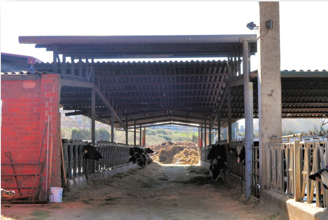
Establació oberta i passadís d'alimentació