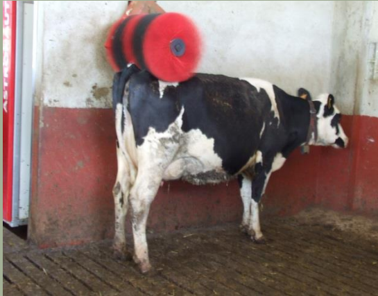
Vaca en el raspall automàtic