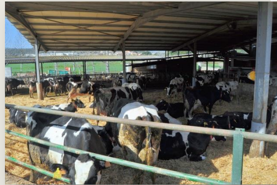
Vaques a la zona pallada