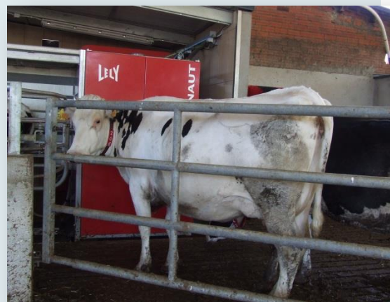
Vaques al robot de munyida