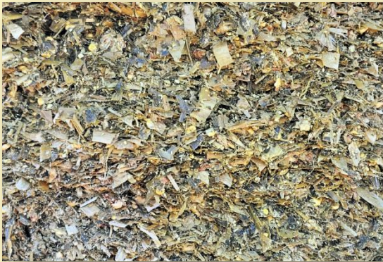
Ensitjat de blat de moro

La ració farratgera canvia en el temps per tal d'adaptar-se a la disponibilitat del raigràs. Ara passarà a fer la següent: 25 kg d'ensitjat de blat de moro, 1,9 kg de palla d'ordi, 1 kg de fenc de raigràs i 30 kg de raigràs verd. La complementació afegida a l'unifeed també canviarà: 2,8 kg tortó de soja 47%, 3 kg de blat de moro y minerals.