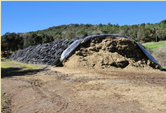
Ensitjat de raigràs