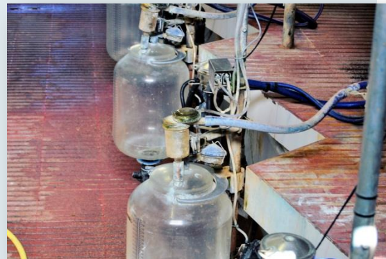
Sala espina de peix 2x6

Les vaques eixutes i les vedelles prenyades romanen a l'aire lliure en una àmplia àrea arbrada, on poden caminar i jeure.