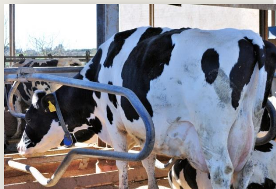
Recria (cobertes als 15 mesos) i vaca seleccionada (de 5 parts, amb mitjana anual de 10.500 kg de llet)

L'any 1990, arran de la segona reforma, va incorporar DAC (dispensadors automàtics de concentrats), els quals continuen en actiu. A més a més, va canviar la sala de munyir paral·lel per una espina de peix, amb mesuradors de pot en línia baixa, 2x6.