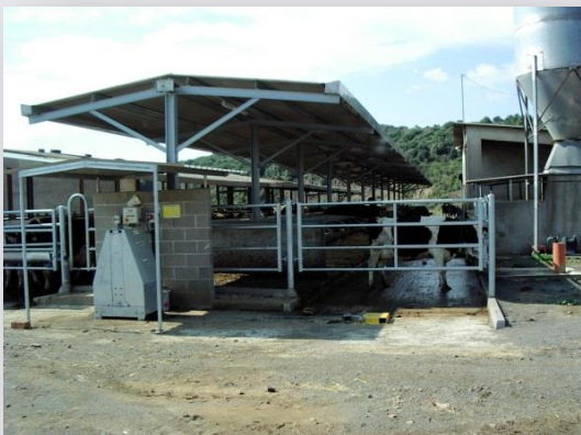
Dispositius per als arrossegadors de fems

L'establació disposa d'arrossegadors automàtics de fems fins a la fossa rectangular, d'una capacitat de un milió i mig de litres, situada al final d'aquella. A criteri del ramader, l'ideal, de cara a remenar-la millor, hagués estat fer-hi una fossa rodona.