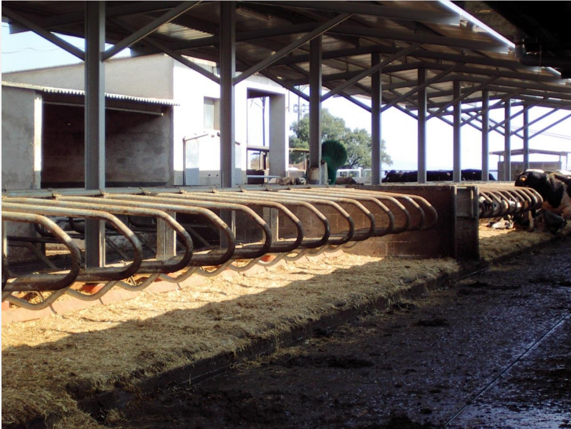
Reforma de l'any 2005, cubicles o llotges amb matalàs

A la superfície farratgera hi fa ordi (destinat a gra, que ven per tal de comprar fenc deshidratat d'userda, i es queda la palla), i el raigràs italià, el cultiu per excel·lència, al que normalment li fa tres dalls, els dos primers per ensitjar i el darrer per assecar. Ara – març 2014 – disposa d'una sitja de raigràs sense obrir.