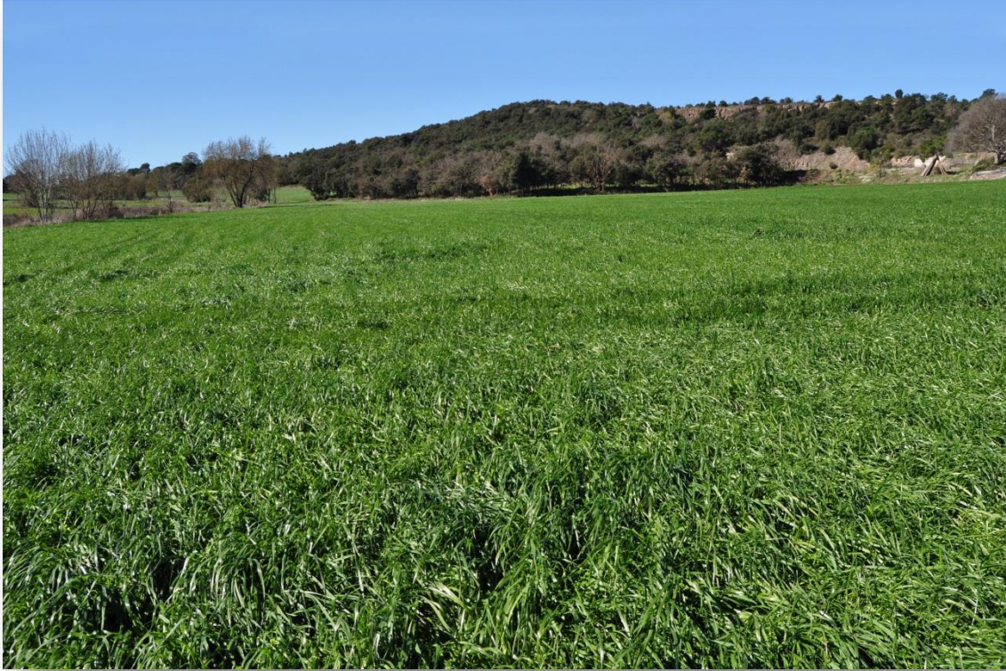
Camp de raigràs italià