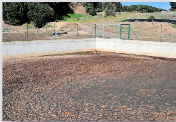
Bassa de fems

A l'apartat "GALERIES DE FOTOS" dins de les visites podem trobar la seqüència de fotos de diverses visites i l'actual.