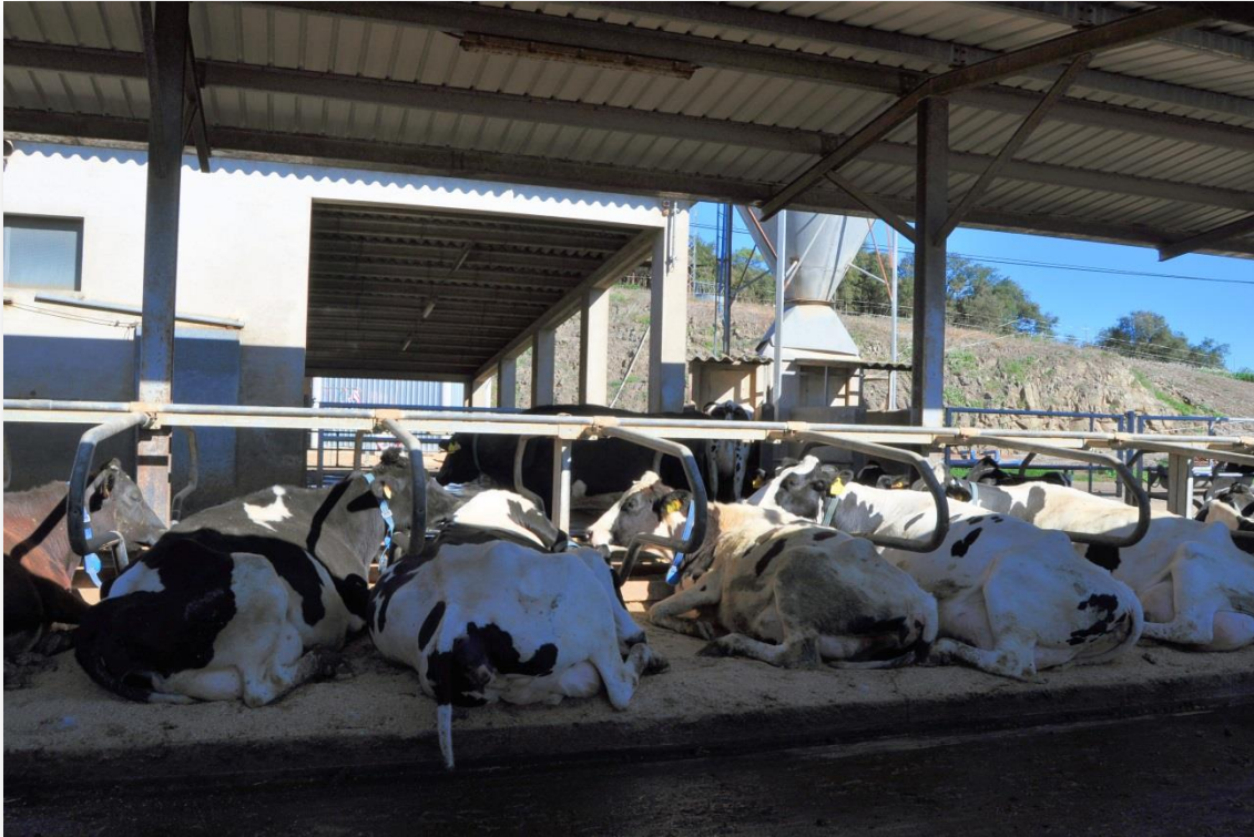
Vaques a llotges o cubicles