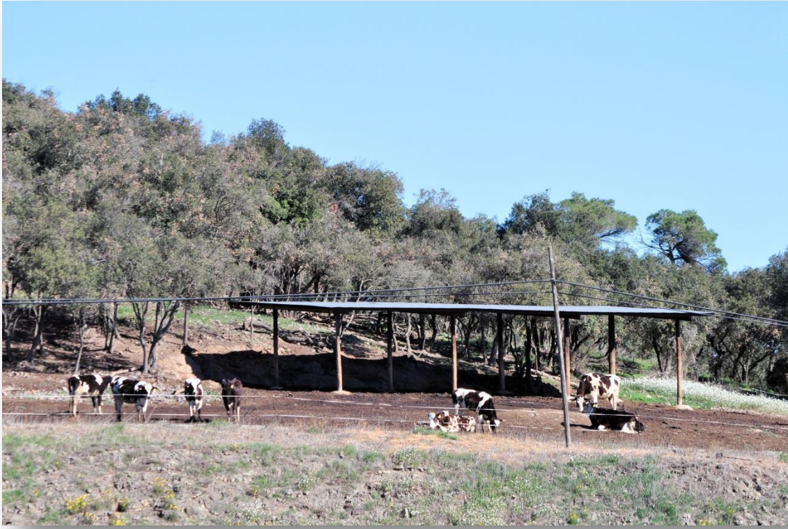
Eixutes i vedelles prenyades

L'establació disposa d'arrossegadors automàtics de fems fins a la fossa rectangular, d'una capacitat de un milió i mig de litres, situada al final d'aquella. A criteri del ramader, l'ideal, de cara a remenar-la millor, hagués estat fer-hi una fossa rodona.