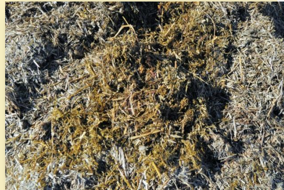
Detall d'ensitjat de raigràs

Pel que fa al maneig del racionament fa una ració unifeed per a 35 kg de llet (a l'hivern la distribueix el matí, i des d'abans d'estiu fins a finals en fa dues distribucions, una al matí i l'altra a la tarda, després de munyir). A les vaques que passen dels 35 kg de llet al dia els subministra una mitjana de 2,5 kg de pinso als DAC.