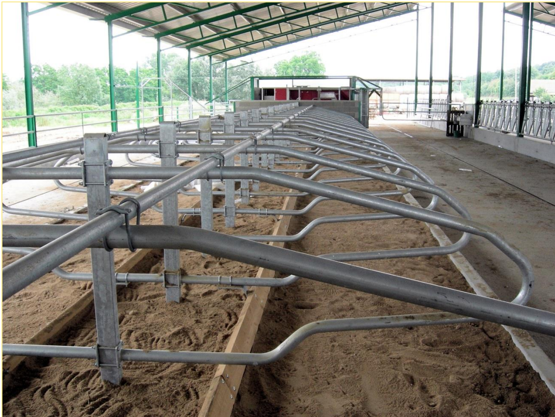
Detall de les llotges

Segons els titulars de l'explotació, la genètica – selecció animal – té com a objectiu tenir vaques funcionals, tant per al maneig en el robot com en la producció. L'estabulació lliure – nova des del 2008 – és de cubicles o llotges en la qual s'integren els dos robots. Tenen, igualment, en actiu la sala de munyir, espina de peix 2x8, per a les vaques no adaptades o amb problemes.