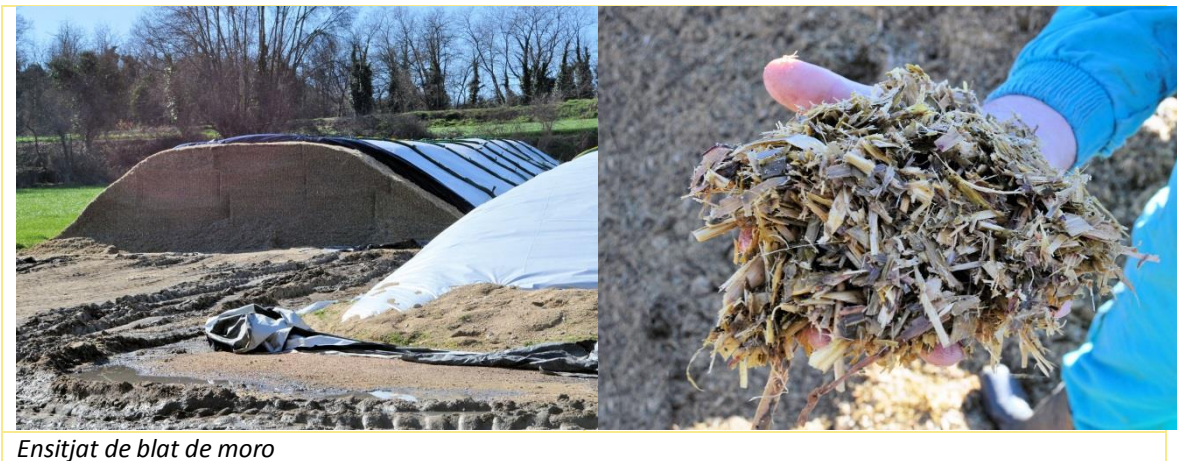
Ensitjat de blat de moro

Els principals cultius són el blat de moro (per ensitjar – 33 % MS – i pastone ), el raigràs italià, que segons l'any li fan de 2 a 3 dalls, espaiats 5 setmanes, el primer dels quals el dediquen a ensitjar en bales (bala embolicada), el segon a ensitjat convencional – 33% MS – i el tercer l'assequen. També fan sorgo.