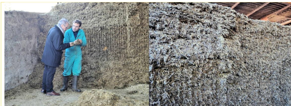
Ensitjat de raigràs

Per a la munyida, integrats a l'estabulació, hi ha dos robots – va ser la primera explotació en posar-ne – tot i que continua en actiu la sala de munyir.