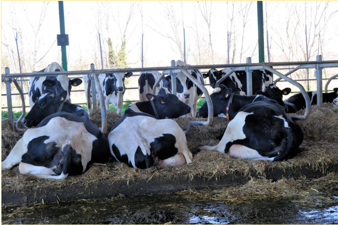
Vaques ajagudes als cubicles

Els principals cultius són el blat de moro (per ensitjar – 33 % MS – i pastone ), el raigràs italià, que segons l'any li fan de 2 a 3 dalls, espaiats 5 setmanes, el primer dels quals el dediquen a ensitjar en bales (bala embolicada), el segon a ensitjat convencional – 33% MS – i el tercer l'assequen. També fan sorgo.