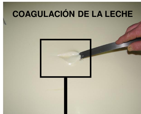
COAGULACIÓN DE LA LECHE