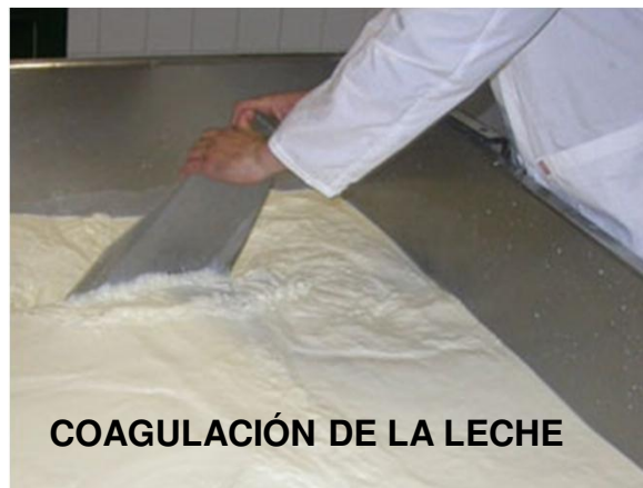
COAGULACIÓN DE LA LECHE