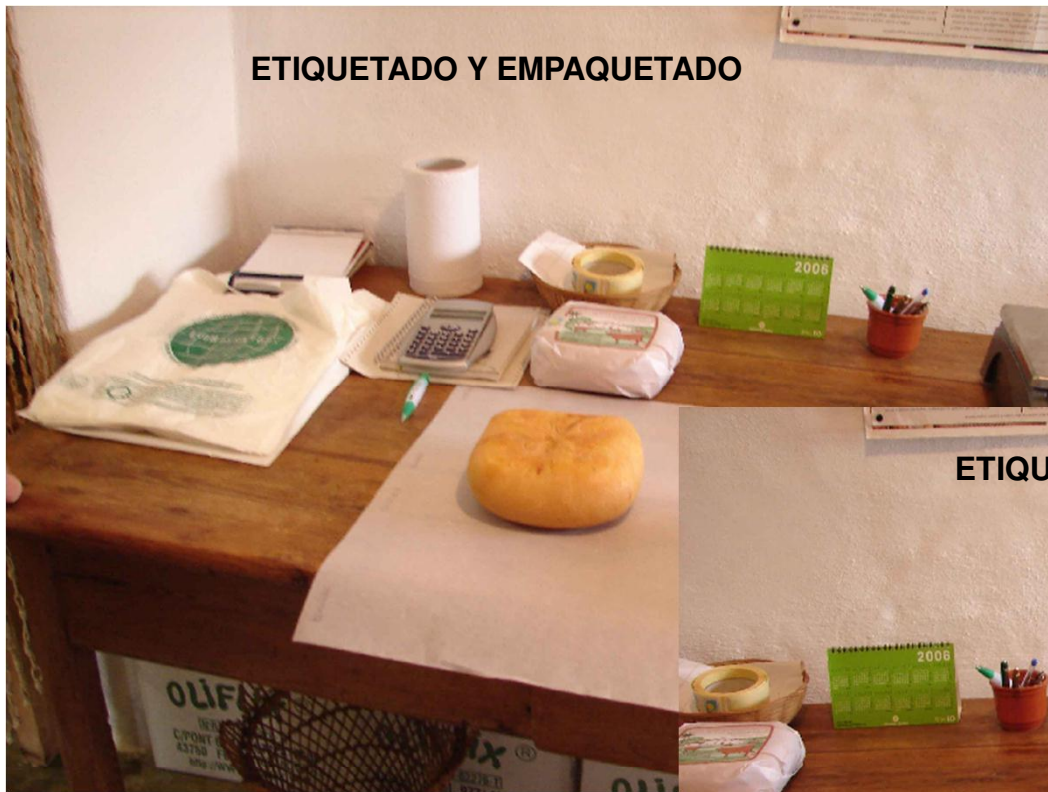
ETIQUETADO Y EMPAQUETADO