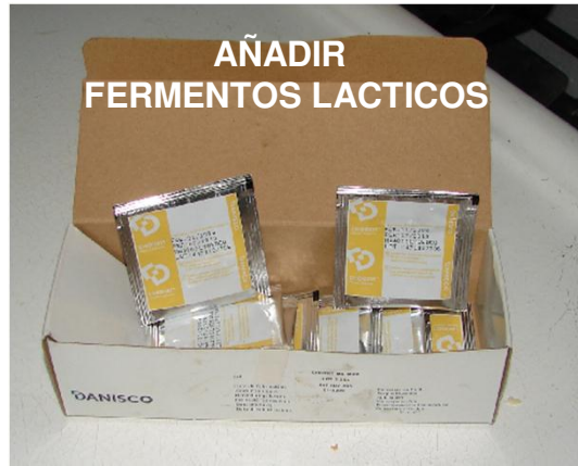
AÑADIR FERMENTOS LACTICOS