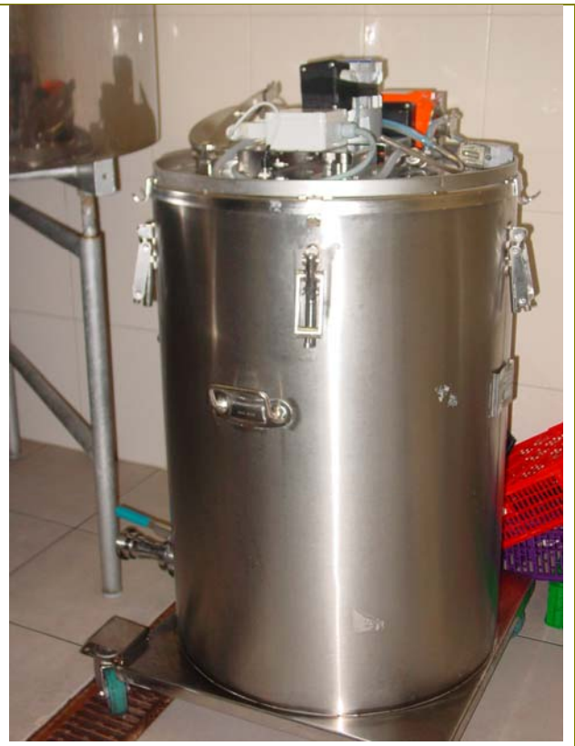
Dipòsit isotèrmic de 230 l per al dispensador de llet