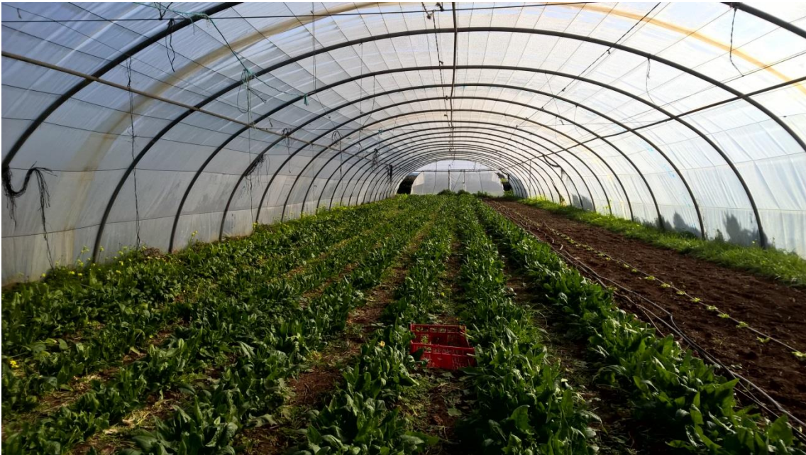
Invernadero de espinacas

Las espinacas a veces aguantan toda la temporada hasta marzo. Después en el mismo lugar no vuelve a sembrar espinacas hasta pasados tres años, ya que el suelo queda esquilado. Luego siembra pimientos y melón. Comenta el agricultor que con el melón no se gana mucho, y, en cambio, sí con las zanahorias y rábanos.