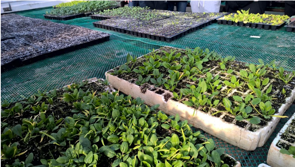
Semilleros de espinacas

En la finca, además de las verduras, dedica 12 hectáreas al vacuno de carne (cuatro vacas menorquinas, un toro y los cuatro terneros). Compró 10 terneros de raza Charoles que engordar y vender la carnicería ECO-CARN de Ciutadella. Todo dentro del sistema ecológico. Pastan avena y sorgo unos 10 meses y pasan a engorde con pienso ecológico.