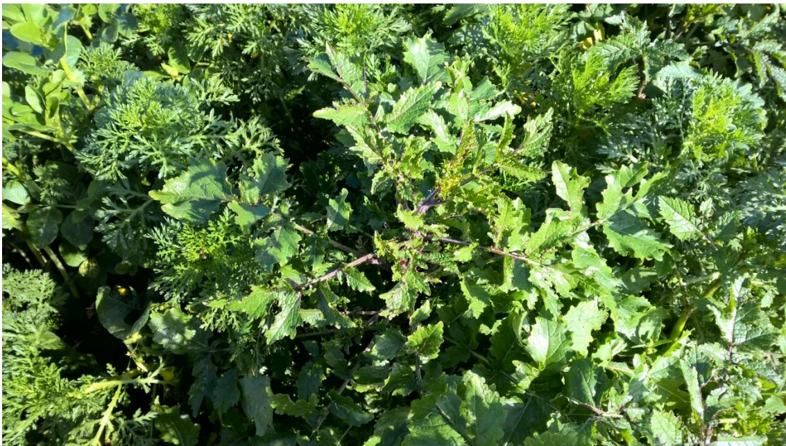
Mostaza utilizada como abono en verde

Utiliza diferentes cultivos para abono en verde, y, lógicamente, lleva una rotación de cultivos adecuada a la riqueza del suelo y lo que absorben las plantas. Por ejemplo, la mostaza la tritura en verde para abono, igualmente con el habón en floración la tritura in situ para abono.