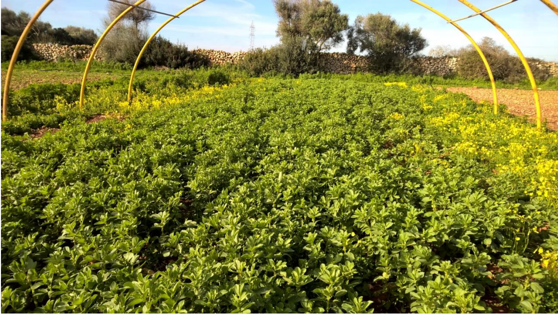
Habón para abono en verde