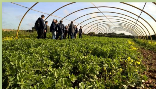
Parella Vella, Ciutadella (Menorca)