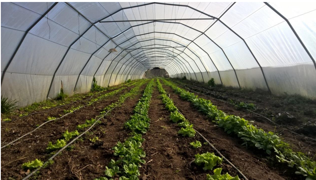
Cultivo bajo invernadero