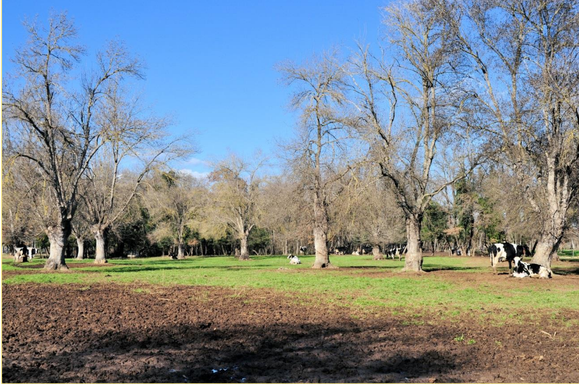
Vacas secas en el prado

Las vacas secas las sacan al prado, consiguiendo, de este modo, un pre y post parto sin problemas (buena condición corporal al parto).