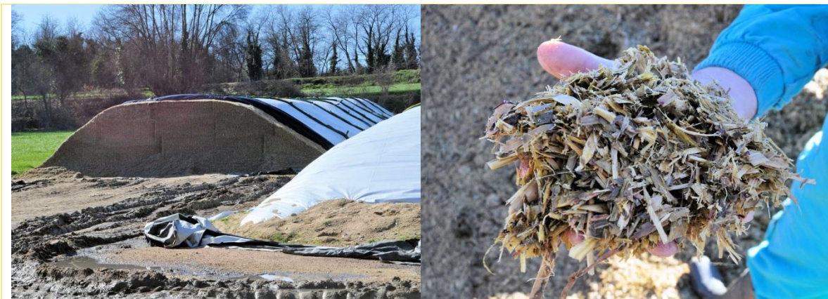
Ensilado de maíz

Los principales cultivos son el maíz (para ensilar - 33% MS - y pastone ), el raigrás italiano, que según el año le dan de 2 a 3 cortes, espaciados 5 semanas, el primero de los cuales lo dedican a ensilado en balas (bala encintada), el segundo en ensilado convencional - 33% MS - y el tercero lo henifican. También cultivan sorgo.