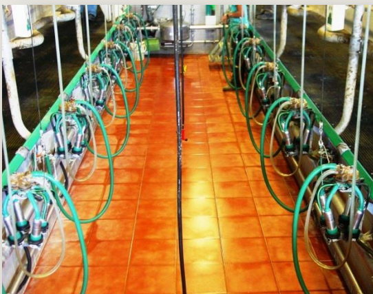
Sala de ordeño 2x6

La sala de ordeño es una espina de pescado 2x6, bien equipada, instalada hace 2 años y medio, al mismo tiempo que el resto de la estabulación, formada por un comedero cubierto para 70 vacas sin cubículos, pajar, fosa de purines, lechería y despacho, para tener todos los papeles bien ordenados. Tiene un programa conectado a la sala de ordeño que le permite saber la producción diaria de cada vaca. El tanque tiene una capacidad de 5.200 litros (recogen la leche cada 2 o 3 días). Para ordeñar unas 60 vacas está una hora y media. El problema, según dice Sebastià, es que la tasa de grasa es muy baja.