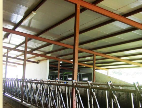
Pasillo de alimentación y pajar

En el apartado "GALERÍAS DE FOTOS" dentro de las visitas podemos encontrar la secuencia de fotos de la visita.