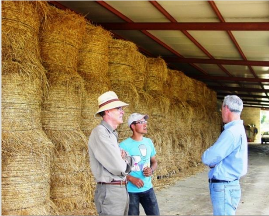
Pajar en la estabulación